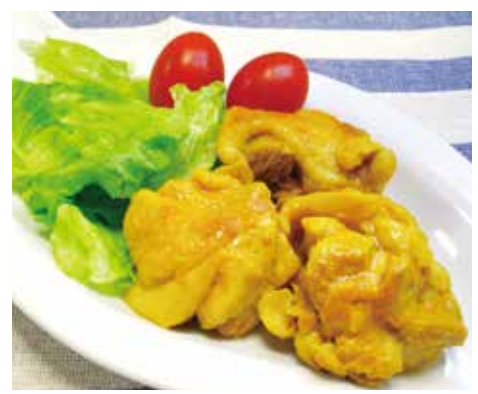
診療支援部 栄養科