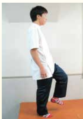
背筋を伸ばして行います。