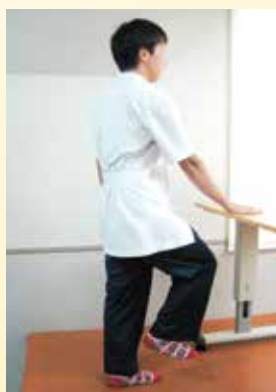
手放しが難しい方は、机に手をつけて行いましょう。