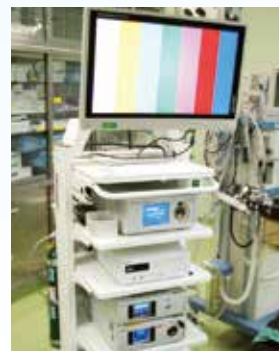
2016年に当院で導入した最新のフルハイビジョン腹腔鏡システムです。

日本内視鏡外科学会では、2005年から実際の手術手技を審査する技術認定制度を行っています。同学会のホームページには技術認定取得者の一覧が公開されているので、こちらも参考にしてください。