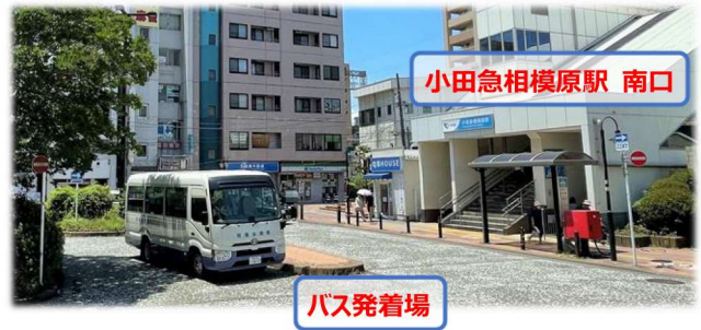
小田急相模原駅 南口

この度、行政からの指導により小田急相模原駅の病院送迎バス停を令和5年6月30日に撤去することとなりました。大変ご迷惑をお掛けいたしますが、バス停撤去後は相模台病院ホームページで時刻表等ご確認していただきますようお願い申し上げます。尚、バス停撤去後のバス乗降場所および時刻表の変更はございません。