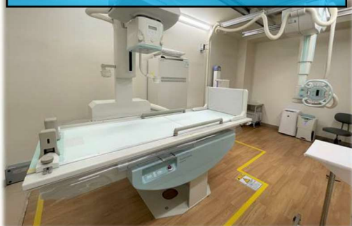
相模台健診クリニック レントゲン室

健康診断における放射線科の役割は、体の外からでは分からない疾患の早期発見、原因究明にあります。